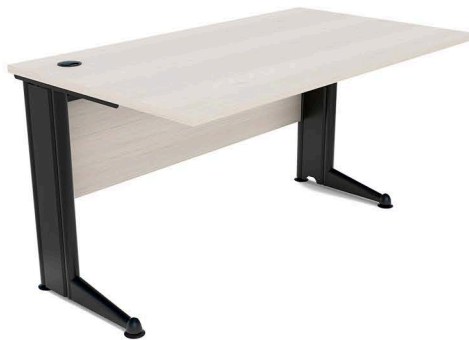
ITEM 02 MESA DE TRABALHO RETANGULAR 1400X600X740MM