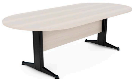
ITEM 13 MESA REUNIÃO OVAL 2000X1100X740MM