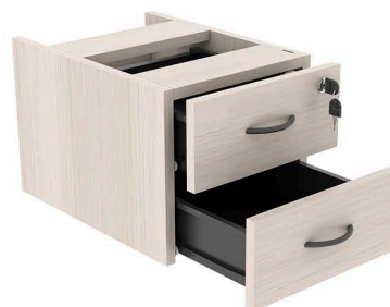
ITEM 16 GAVETEIRO FIXO COM 02 GAVETAS