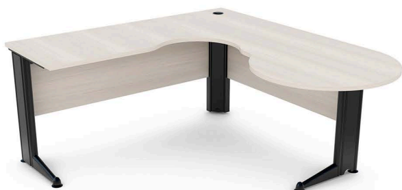
ITEM 07 MESA TIPO GOTA 1600X2000X600X800X740MM