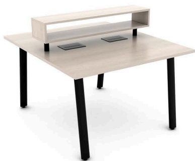
ITEM 09 ESTAÇÃO DE TRABALHO PARA 02 LUGARES