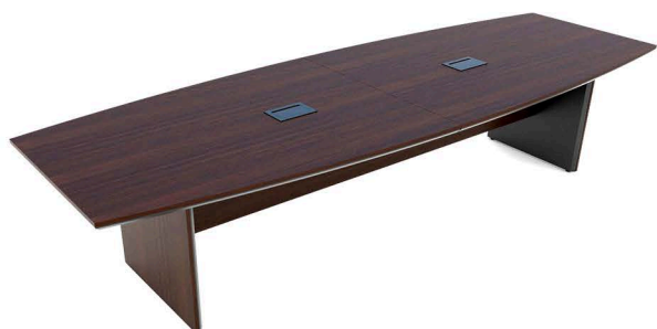
ITEM 15 MESA DE REUNIÃO ELIPÍTICA 3500X900X1200X900X740MM