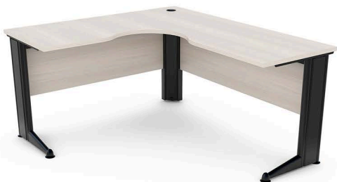
ITEM 05 MESA DE TRABALHO EM "L" 1400X1600X600X600X740MM