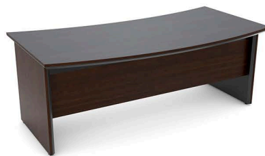
ITEM 10 MESA DIRETORIA 2000X900X740MM