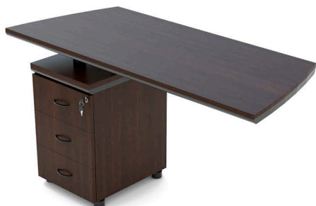
ITEM 11 SUPERFÍCIE AUXILIAR 1150X600X740MM