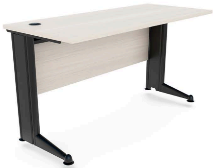
ITEM 01 MESA DE TRABALHO RETANGULAR 1200X600X740MM