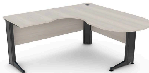
ITEM 06 MESA TIPO PENINSULA 1400X1800X600X800X740MM