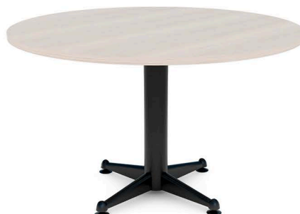
ITEM 12 MESA REUNIÃO REDONDA 1200X740MM