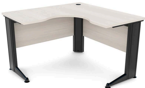
ITEM 03 MESA DE TRABALHO EM "L" 1200X1200X600X600X740MM